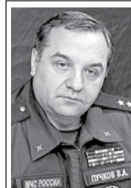
Владимир Пучков, глава МЧС РФ:

В чем преимущество Кузбасса по отношению к другим регионам страны? На вопрос отвечают известные люди