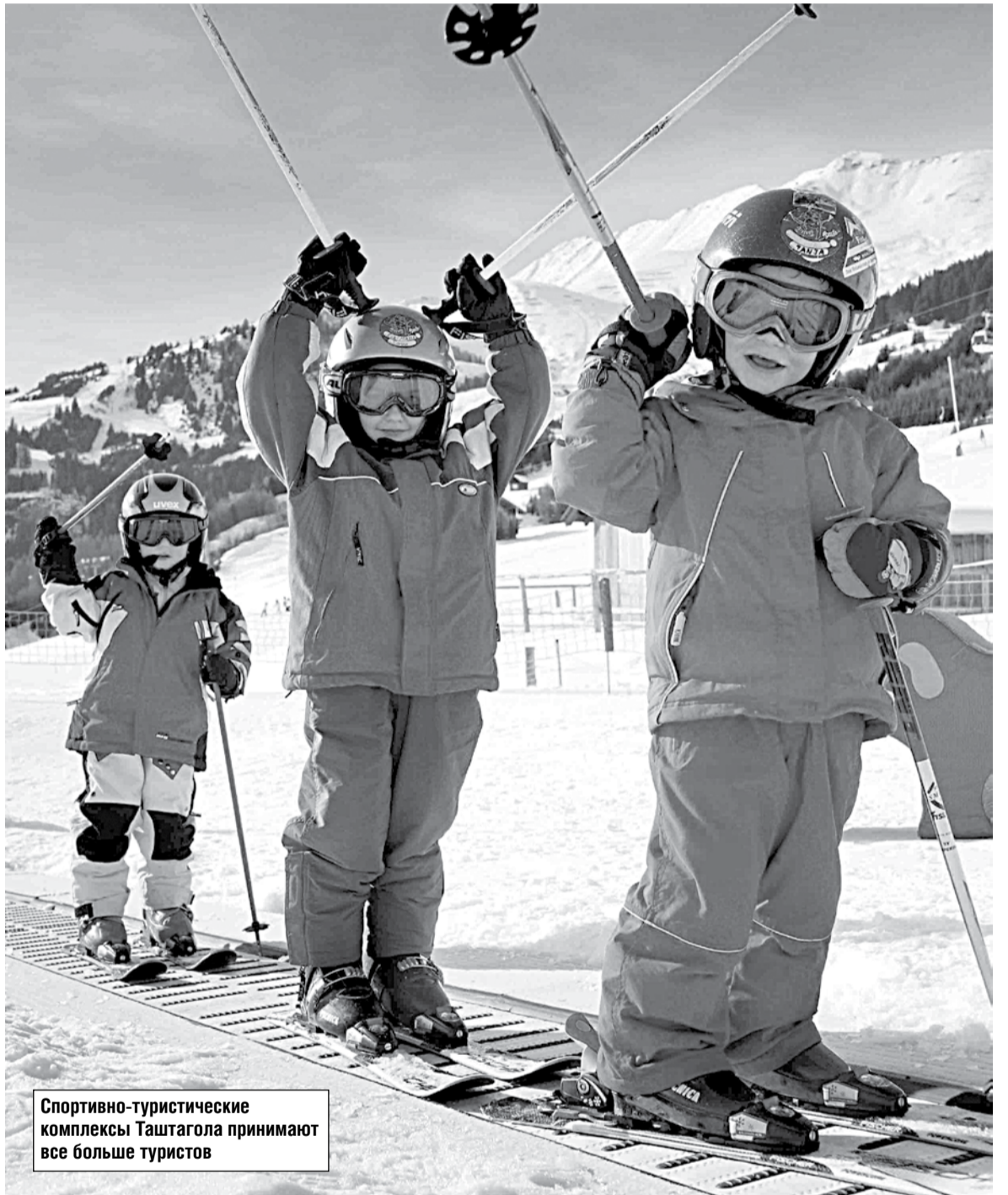
Спортивно-туристические комплексы Таштагола принимают все больше туристов

Высокой заработной платой похвастаться не можем. Данные разных источников сильно отличаются друг от друга. Возьмем стороннего «арбитра» — Новосибирскстат. По данным этого информатора, в январе — сентябре 2016 года жители Кемеровской области зарабатывали в среднем 29 002 рубля. По итогам января-сентября 2016 года Кузбасс занял